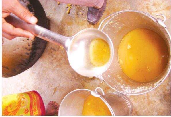
ଲିପିଲୋଇ ବସେଶ୍ୱର ଉଚ୍ଚ ପ୍ରାଥମିକ ବିଦ୍ୟାଳୟରେ ଚରକାରିରେ ପୋକ